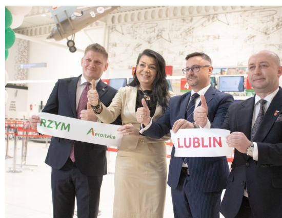
Bezpośrednie relacje i promocja przedsiębiorstw

Misja została zaprojektowana w sposób ukierunkowany na osiągnięcie konkretnych efektów biznesowych. Jeszcze przed wyjazdem prowadzony jest proces identyfikacji i doboru partnerów włoskich na podstawie profilu działalności uczestników, dzięki czemu spotkania